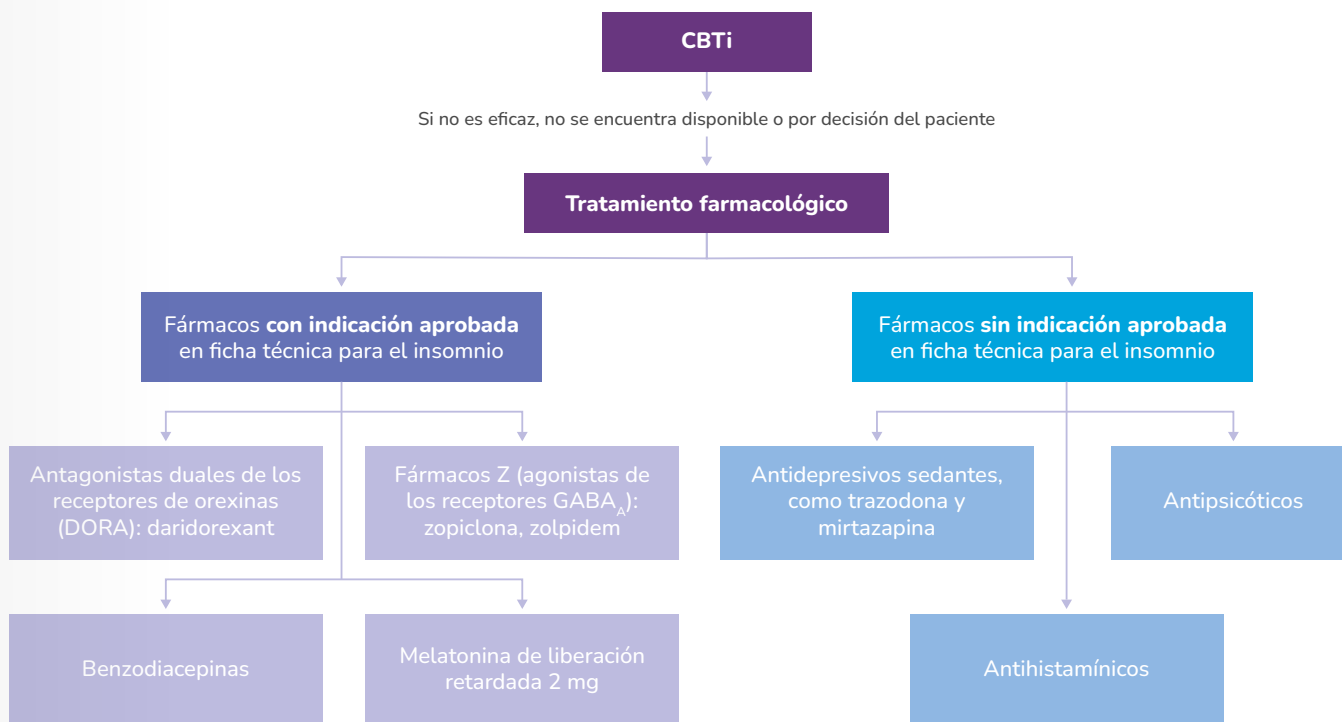
Figura 1. Estrategias terapéuticas recomendadas en el tratamiento del insomnio.

En la figura 1 se representa lo descrito anteriormente para las distintas estrategias farmacológicas, señalando nuevamente que estas sugerencias son generales y que es necesario individualizar las decisiones terapéuticas en cada caso.